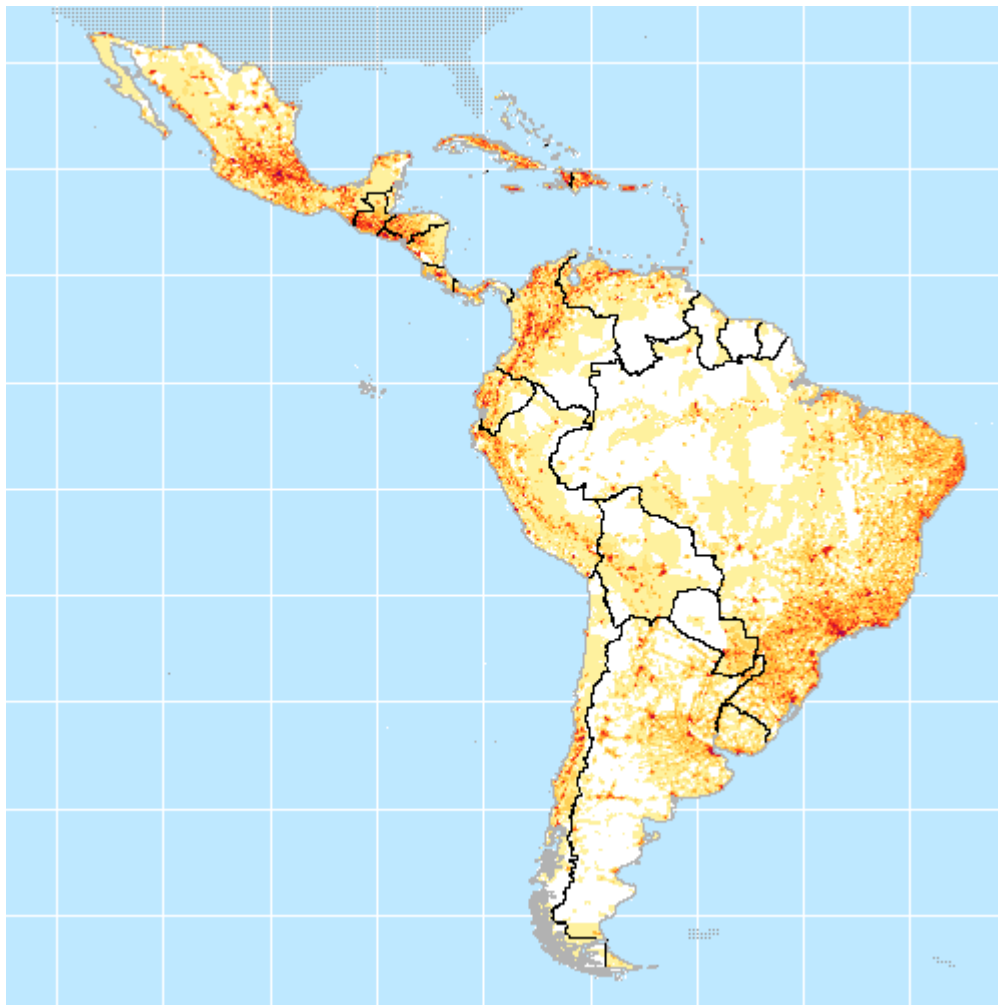
Рис. 1. Щільність населення Латинської Америки, 2010 рік

Завдання 4. Користуючись сайтом «Рейтинг урбанізації стран мира» (режим доступу : http://gtmarket.ru/ratings/urbanization-index/info ), визначте рівень урбанізації країн Латинської Америки. Заповніть табл. 20. Проаналізуйте отримані дані, а також карту урбанізованих ареалів Латинської Америки (рис. 2). Зробіть письмовий висновок, зазначивши: