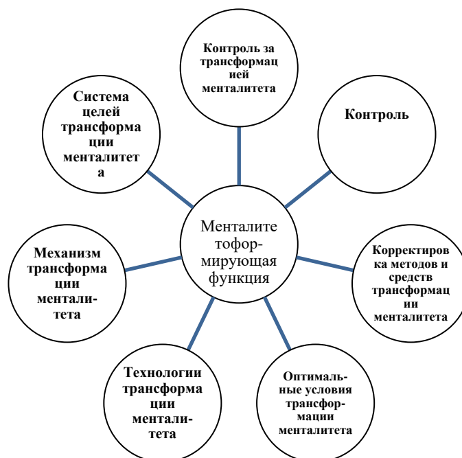
Рис. 2. Задача менталитетоформирующей функции